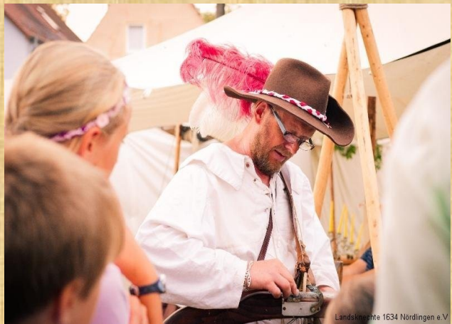
Landsknechte 1634 Nördlingen e.V.