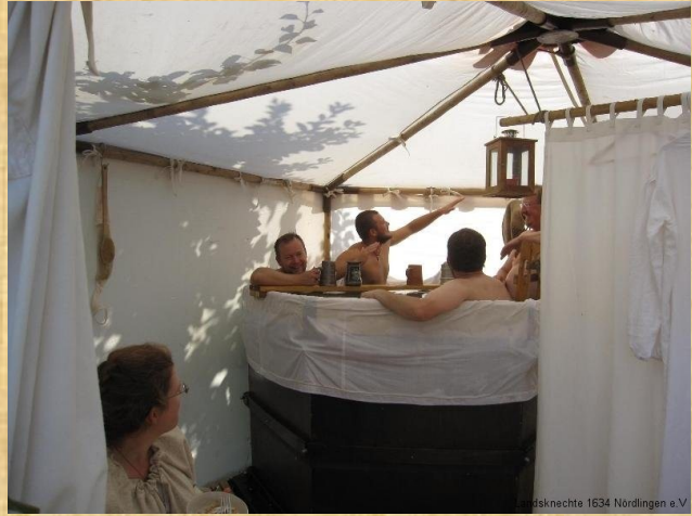
Landsknechte 1634 Nördlingen e.V.